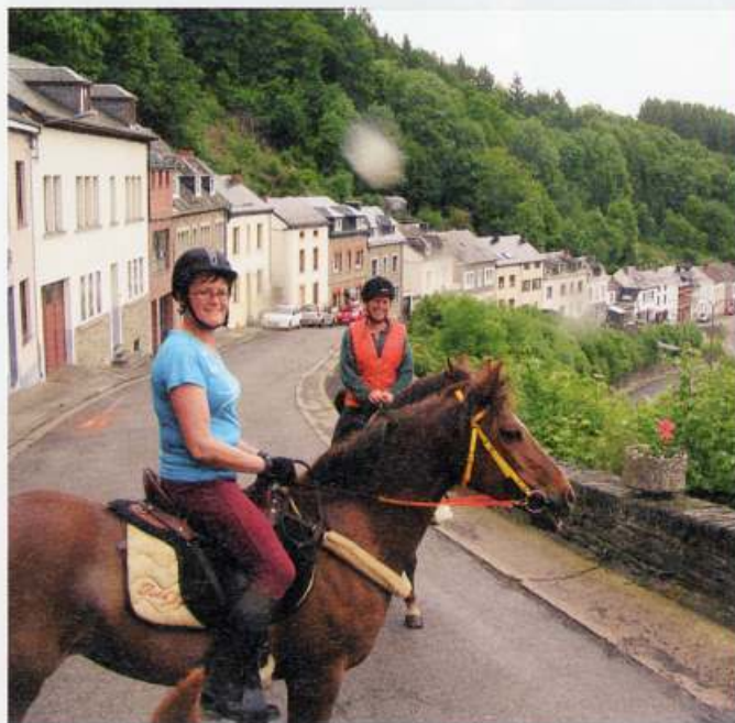
DOOR HET DORP.