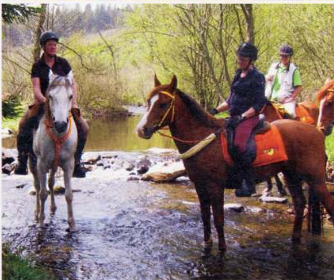
DE PAARDEN KOELN GRAAG HUN BENEN IN SNELSTROMENDE BEEKJES.