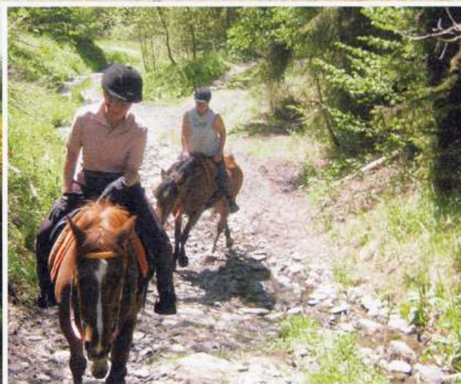
OMHOOG DOOR EEN DROGE RIVIERBEDDING.