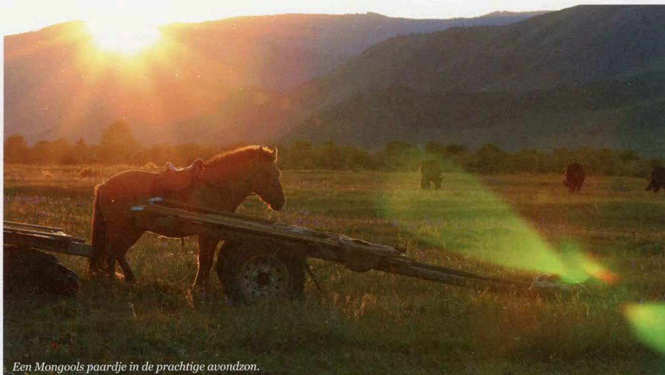
Een Mongools paardje in de prachtige avondzon.

malse weide tussen de bergtoppen. In de winter liggen hier dikke pakken sneeuw, weet mijn gids, die in de wintermaanden de kost verdient als snowboard-instructeur. Nu kunnen wij hier nog genieten van een aangenaam herfstzonnetje en natuurlijk de warme kachel in de restaurant-ger 's avonds. Deze keer rijd ik op een zeer licht palominokleurige ruin. Wederom een knaap die stevig op zijn benen staat en flink werkt, zonder gek gedoe en zonder tekenen van vermoeidheid. 's Avonds staan de paardjes te grazen zij aan zij met de kamelen. Met het geluid van hun gekauw op de achtergrond kruip ik na het diner in mijn slaapzak. In plaats van schaapjes tel ik kamelen en paarden. Ik kom niet ver voor ik in slaap val. Paardrijden, frisse lucht en lekker eten. Geen storende telefoongeluiden want ook hier geen bereik. De ultieme back-to-basics ervaring. Ik droom nu al van mijn volgende tripje naar het prachtige Mongolië. 🐾