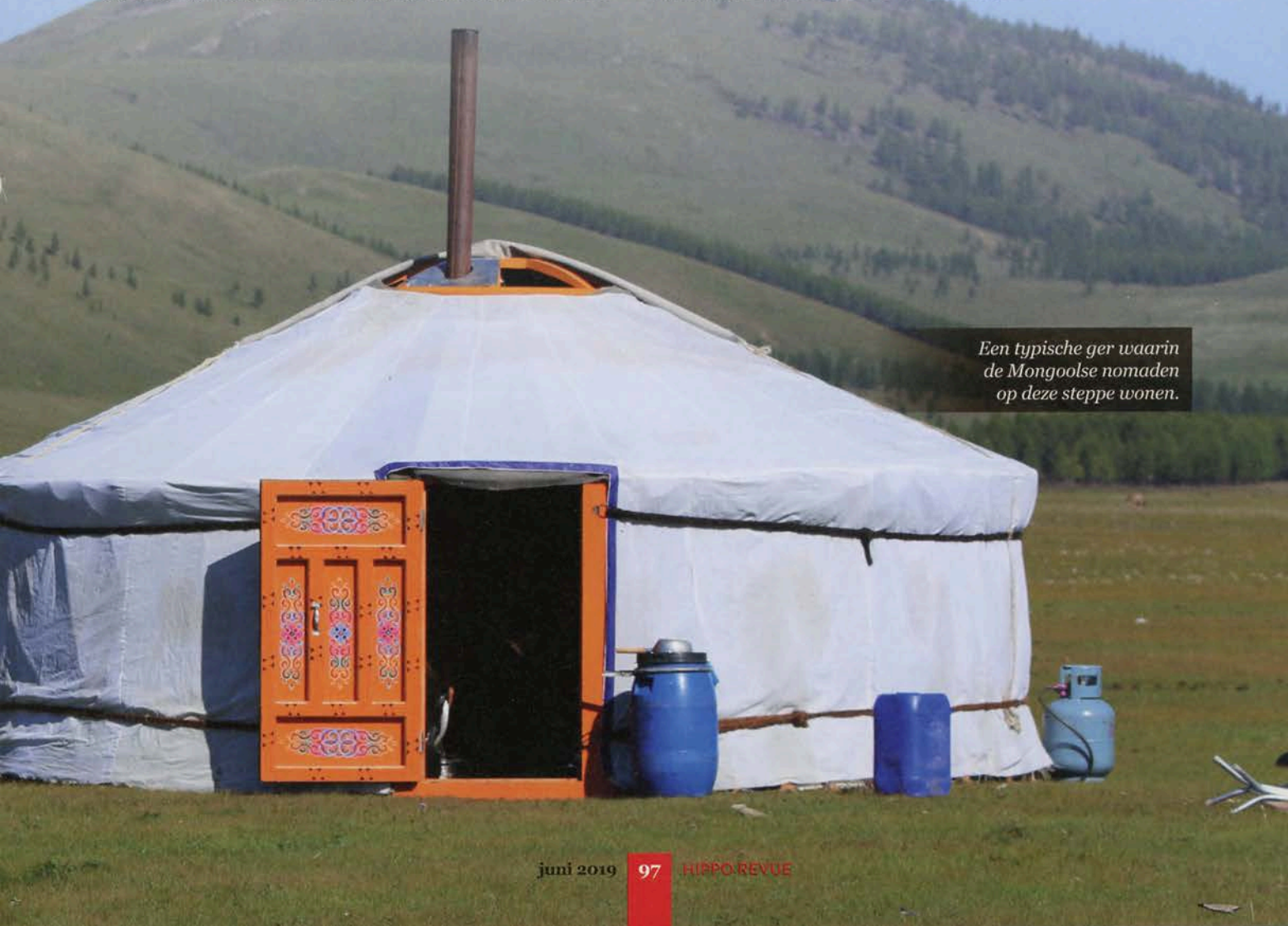
Een typische ger waarin de Mongoolse nomaden op deze steppe wonen.

De daaropvolgende dagen leren we de streek veel beter kennen. We rijden langs grote kuddes dieren. Bij een ger is een vrouw merries aan het melken. Een herder hoedt zijn geiten en schapen, terwijl een arend over onze hoofden draait. Wanneer